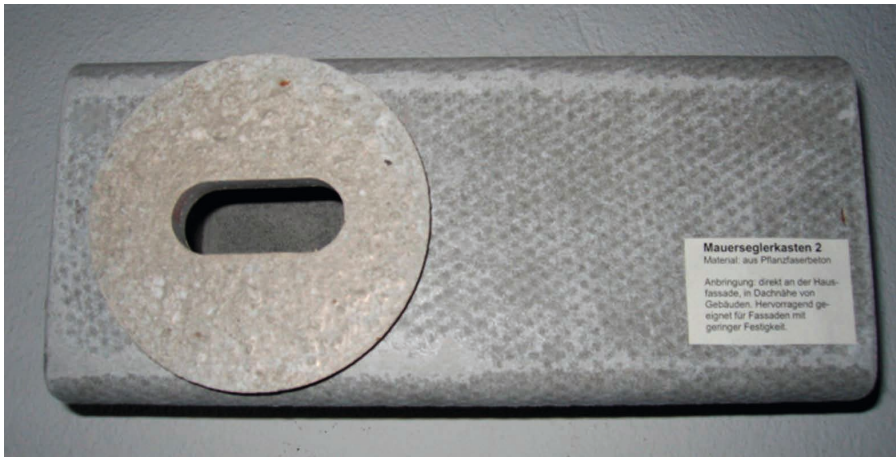
Abb. 3: Der seit Jahrzehnten mit großem Erfolg europaweit eingesetzte Mauerseglerkasten Typ 17 der Firma Schwegler.

Durch das Projekt zur Erhaltung gebäudebewohnender Tierarten, welches seit dem 01.01.1996 vom Naturschutzzinstitut Region Dresden e.V. in diesem Zusammenhang realisiert wird, konnten bis 2010 insgesamt ca. 10.000 Nisthilfen für Falken, Dohlen, Eulen, Fledermäuse und Mauersegler an öffentlichen und privaten Gebäuden angebracht werden (NSI 2010a). Im Zeitraum von 1996 bis März 2003 wurden durch das NSI im Rahmen dieses Projektes in enger Zusammenarbeit mit der Unteren Naturschutzbehörde Dresden, den Wohnungsgesellschaften, Kirchen, dem Studentenwerk und der Uniklinik Dresden 3.313 Ersatzquartiere für den Mauersegler im Dresdner Stadtgebiet bereitgestellt (NSI 2010b). Bis einschließlich 2012 erhöhte sich die Zahl auf insgesamt 6.981 Ersatzquartiere für Mauersegler in Dresden (NSI 2012). Die Abb.3 und 4 zeigen verwendete Nisthilfen.