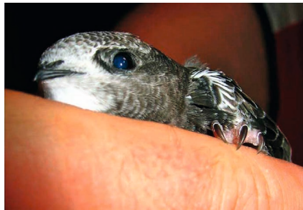
Abb. 1: Mauersegler ( Apus apus ), links adultes Tier, rechts juveniles Tier.

Seit 1991 erfasste eine verstärkte und immer noch andauernde Bau- und Sanierungswelle die Städte Sachsens. Eine Vielzahl von Wohngebäuden und Geschäftshäusern wurde in dieser Zeit abgerissen, neu errichtet oder saniert. Damit ging einher, dass sowohl durch die Neuversiegelung von Flächen als auch durch die Sanierung bzw. den Verlust alter Gebäudesubstanz immer mehr